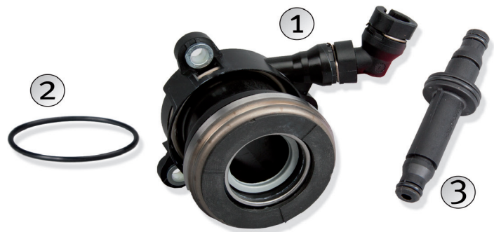
Bild 2: LuK CSC 510 0073 10

Der Zentralausrücker, kurz CSC (engl. Concentric Slave Cylinder) unterliegt wie Kupplung und Schwungrad genauso dem natürlichen Verschleiß und sollte daher bei jedem Kupplungswechsel erneuert werden. Dabei ist beim Einbau auf einige Dinge zu achten, um die Funktionalität und die Langlebigkeit der Bauteile zu gewährleisten. Zu beachten ist, dass die Bauform des eingebauten CSC vom LuK CSC mit der Art-Nr. 510 0073 10 abweichen kann. In diesem Fall ist das Ausrücksystem „umzurüsten“.