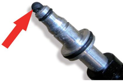
Bild 4: Wurde der alte Dichtring nicht entfernt, wird dieser in Richtung CSC gedrückt und verstopft die Leitung

Nach der Erneuerung des Zentralausrückers ist es notwendig, das System zu entlüften. Hierbei teilt sich der Entlüftungsvorgang in zwei Schritte. Einerseits muss die Kupplungsbetätigung entlüftet werden, andererseits wird der Zentralausrücker separat entlüftet.