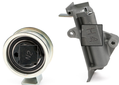
Bild 2: Spannrolle 531 0436 20 mit Schwingungsdämpfer 533 0035 10