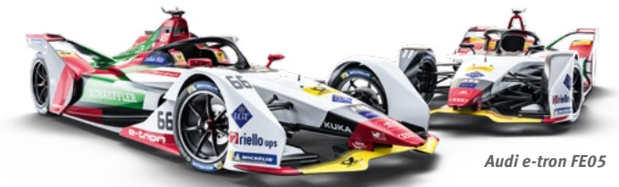
Audi e-tron FE05

Punktesystem 1. 25 Pkt. 2. 18 Pkt. 3. 15 Pkt. 4. 12 Pkt. 5. 10 Pkt. 6. 8 Pkt. 7. 6 Pkt. 8. 4 Pkt. 9. 2 Pkt. 10. 1 Pkt.